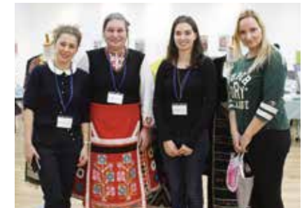
イベントでご協力いただいたブルガリアの方々

観光地・世界遺産 首都ソフィアの歩行者天国や大統領府の衛兵交代、リラ修道院などの歴史的な寺院、プロブディフのローマ時代の円形劇場跡、トラキア王家の谷の墳墓群、ヴァルナなどの黒海リゾート、 Banskoなどのスキーリゾートとスパ、博物館都市・コプリフシュティツァ、民族復興期の家屋を保存した、ボジェンツイなどの建築保護区など。世界遺産では、フレスコ画が素晴らしいボヤナ教会、カザンラクのトラキア墳墓、黒海に突き出たギリシア時代からの港町ネセバルなど、見どころと魅力いっぱいブルガリアです。