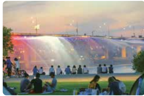
月光レインボー噴水

都心の派手なビルの森の街でダイナミックな情熱がみなさんを引き寄せ、良才川の恋人の街ではロマンチックな趣が人目を引きまします。このように都心と自然が調和した瑞草に来て、あなたのお好みに合わせてあちこちの魅力を味わってください。(2023年12月1日)