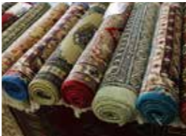
伝統工芸品の展示・販売

伝統工芸品の展示コーナーには、細かい模様が織り込まれた6畳ぐらいありそうな絨毯、重厚で細かい彫刻が施された紫檀の椅子、淡い青緑色に金色の精細な象嵌が施された青磁のように見える漆塗の木製皿、赤黄青緑金銀白黒朱色の幾何学模様が細かく刺繍された民族衣装などが置かれ、いずれも細工の繊細さと伝統の豊かさに驚かされました。いちばん興味を惹かれたのは、木製のナッツ容器です。平たいポット置きに見えますが、外側の取っ手を引っ張っていくと、立体的な容器に変身。子どもたちが興味津々で、見入っていました。