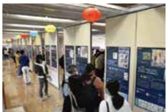
↑台湾漫画夜市の展示