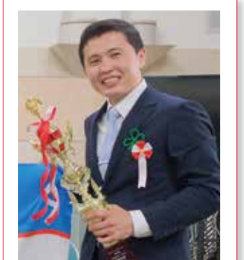
昨年の最優秀賞受賞者