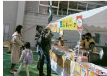
本場パキスタン料理の販売

マスクをかけ、1人ずつおでこに検温器を当てられ健康チェック、さらにカードに名前と連絡先を記入したうえで入場。会場入口には、パキスタン料理の屋台が2つ並び、それぞれ10人ぐらいの店員が料理をつくったり、販売したりで大忙し。エスニックな香りがたぐい、民族衣装を着た家族連れのパキスタン人も、日本人も、カレーや串焼きなどを注文しています。パキスタン人男性には背が高く、がっしりした体格の人が目につきました。パキスタンには主要な4民族がいるそうです。