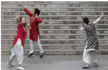
パキスタンの民族舞踊

その階段途中の広い踊り場で、オープニングセレモニーが行われ、またタブラ(太鼓)や民族舞踊が演じられました。天幕からはいくつもの電球が下がっていて、これは女子美術大学学生の作品だとのこと。きょうの会場は小学校校舎(旧杉四小)だったとは思えない、遊びの要素がふんだんに見受けられるユニークな建物。教室と教室のあいだの仕切りはあるものの、廊下部分との仕切りはないオープン・スペースで、大勢の方がゆったりと見てまわっていました。