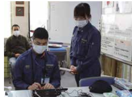
119番通報訓練の説明