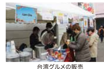
台湾グルメの販売