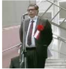
イムティアズ・アハマド駐日パキスタン大使のご挨拶

屋台のある中庭の両側には3階建ての細長い建物が並んで建っています。建物と建物との空間に、オープンな天幕がかかった長い階段が2階までまっすぐ、緩やかな傾斜で伸びていて、ミュージカルの大劇場の舞台にある階段を大きく長くしたように見えます。