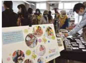
ペーパーミラクルズによる活動紹介・物産販売