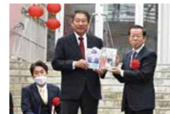
謝長廷 台北駐日経済文化代表処代表(右端)