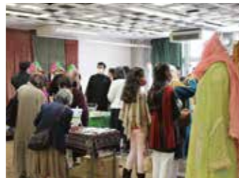
NPO Jasmine Association物産販売

新型コロナウイルス感染症の感染拡大がようやく収まってきたので開催できた海外文化セミナー。秋晴れにも恵まれ、楽しく充実したパキスタンを満喫できました。(ボランティアS)