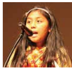
エベレスト・インターナショナルスクール・ジャパンで学ぶ小学4年生