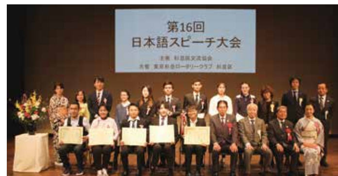
第16回 日本語スピーチ大会