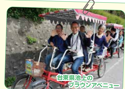
台東県池上のブラウシアベンチャー