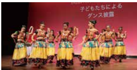
子どもたちによるネパール舞踊

者も自らの体験をしっかりと日本語で話しました。スピーチの後には、エベレスト・インターナショナルスクール・ジャパンの生徒による可愛いスピーチと民族舞踊の発表および和楽器(尺八・津軽三味線)と洋楽器(キーボード・ギター)のユニット「DEN」による演奏があり、会場は和やかな雰囲気に包まれました。審査の結果、最優秀賞1名、優秀賞2名、審査員特別賞2名が選ばれ、参加者一人ひとりに審査員からコメントが述べられました。今回12名の発表を聞き、様々な経験をしながらも日本で頑張っていきたいという熱い思いに胸を打たれました。この頃は区内でも外国人の姿をよく見かけます。機会があれば彼らと交流し、頑張っている人を応援したいと改めて感じた一日でした。(広報I)