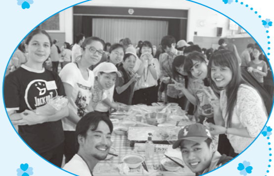
談笑しながら美味しく昼食を

お湯を入れればできる区備蓄のアルファ米に丸美屋食品提供のふりかけを加えおにぎりをグループ毎で作りました。