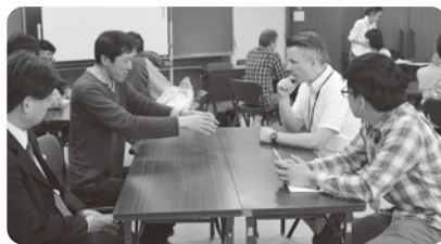
参加者と外国人ボランティアが意見交換