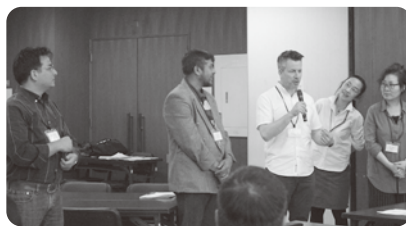
外国人ボランティアが自己紹介

今回、外国人の方に日本語について直接意見を聞くことができ、実際の場でもすぐに活用できるとも有意義な講座でした。