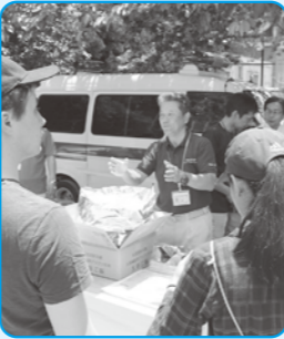
ガスメーターの復旧を体験