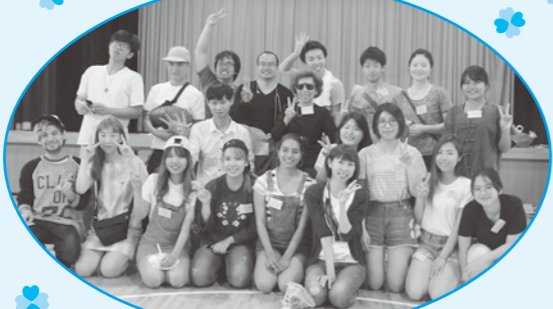
グループで記念撮影

レクリエーションタイム。チームに分かれジャンケン、ジェスチャーゲームなどを次々に行っていくながてメンバー同士仲良くなりました。