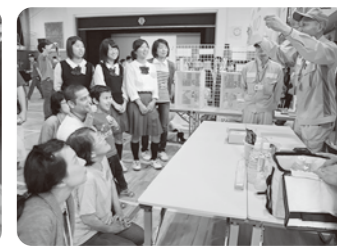
ゴミの分別クイズで動違いに気づいたこともたくさん