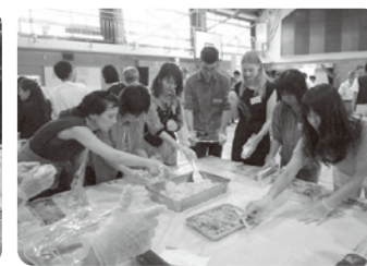
防災米(アルファ米)を使っておにぎりづくりに挑戦