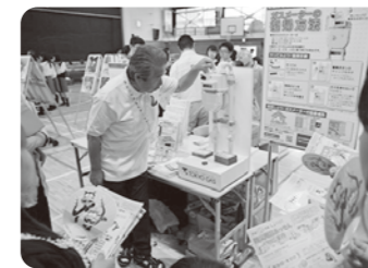
ガスメーターの復旧方法を教えてもらいました