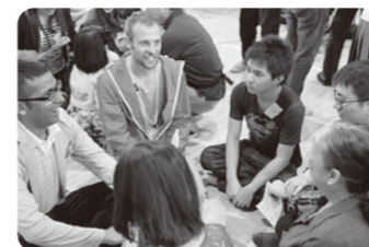
チーム毎に自己紹介をしたり意見交換