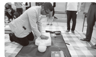
まちなかで見かけるAEDですが使うのは初めて

はじめに杉並区交流協会事務局から、「杉並区で安心して暮らすための基本的なルールや、ゴミの出し方、緊急時に必要な知識と一緒に学びましょう。そして参加者のみなさんと一緒に交流を楽しみましょう」と主旨説明がありました。