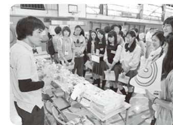
豊富な非常食の数々や便利な防災グッズの説明に納得

ゲームを通じて参加者を10チームに分けて、チーム毎に自己紹介で親睦を深めたあと、チームごとに防災体験ブースを順番に回りました。119番に通報する体験やゴミの分別方法をクイズ方式で再確認したり、地震で止まる仕組みになっているガスメーターの復旧方法、さまざまな防災グッズを手にとって担当者から説明を聞き、