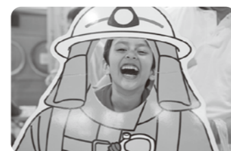
子どもたちが楽しめる心配りもあちこちに

このイベントは、杉並警察署、杉並消防署、杉並消防団、杉並区防災課、杉並清掃事務所、東京ガス(株)、丸屋食品(株)、NPO法人すぎなみ環境ネットワーク、葛飾福祉工場のみなさんの協力を得ることで、参加者に非常に充実した防災に関連する知識や体験の機会を提供することができています。関係者が外国人のたたちに、どのようにしたら災害時に必要な情報を伝えられるかを工夫し、事前によく準備されていたのが印象的でした。