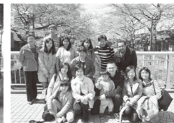
善福寺川でのお花見