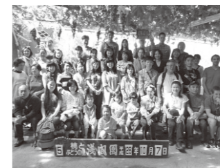
甲府方面へバスハイク

LTCの活動に参加してくださるボランティアの方がいらっしゃいましたら、ぜひご連絡を!また、LTCで日本語を話したい学習者の方もどうぞいらしてください。興味のあるかたはLTCの山形まで。yamamiho@zg7.so-net.ne.jp (文責:LTC友の会 山形)