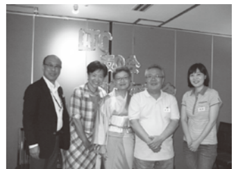
記念パーティーで