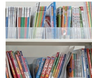
絵本や教材を揃え日本語の学習に役立てています。