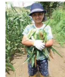
子どもたちとトモロコシの収穫体験に行きました。

日本社会の共通言語である日本語をしっかりと身につけることは、子どもたちの未来を拓き、一人ひとりが幸せな人生を歩むことにつながります。それと同時に、日本社会を私たちと共に担ってくれる「人財」をつくることになると言えます。どうか子ども日本語教室の活動にご理解いただき、お力添えくださいますようお願いいたします。