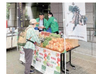
福島県南相馬市との交流