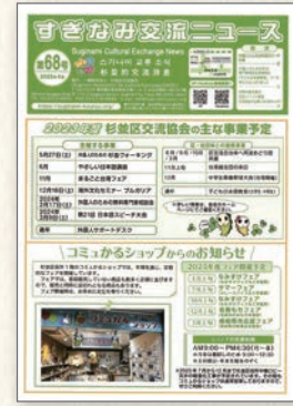
すぎなみ交流ニュース