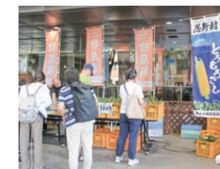
山梨県忍野村との交流

阿波おどり団の派遣や子どもたちによる相互交流、交流自治体の物産展等を通して、行政間に限らず住民同士、団体同士の交流を進め、それぞれの地域が抱える課題の解決へ取り組む「共存共栄」の関係を築いていきます。