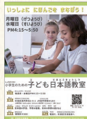
「子ども日本語教室」募集ポスター