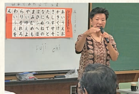
日本語の修得状況に応じてグループで楽しく学べます

日本語教育に取り組むボランティアグループと連携し、交流協会の会議室で外国人の日本語学習を開催しています。