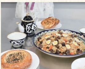
料理教室では「食」から海外の魅力を体験できます