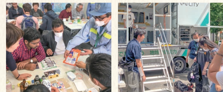
ゴミの分別を学べる講座や起震車の体験会などを実施しています

防災対策やゴミの分別など、日本で暮らしていくのに必要な知識を、体験を通じて学べる講座を開催しています。