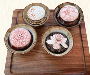
台湾といえばお茶。茶芸の体験会が人気です

講演会、ワークショップ、民芸品の展示のほか台湾グルメ・物産の販売を通して、台湾の歴史や文化を紹介し、理解を深め、相互交流の推進を図っています。