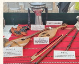
民族衣装や民芸品の展示を通して歴史や文化を学べます