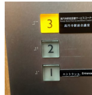
エレベーターで3階(かい)へ