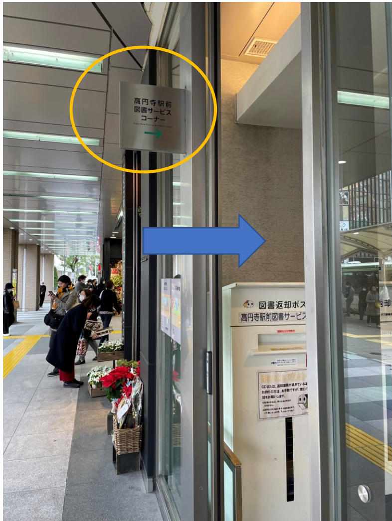
高円寺駅前図書(こうえんじえきまえとしよ)コーナーの看板(かんばん)が目印(めじるし)