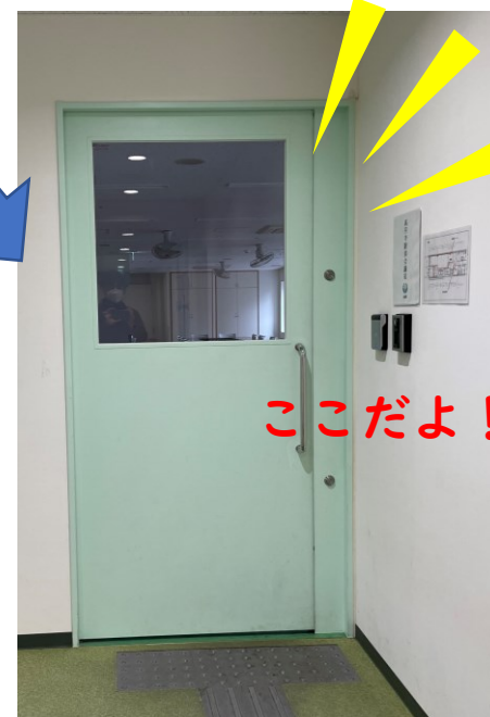
教室(きょうしつ)の入口(いりぐち)