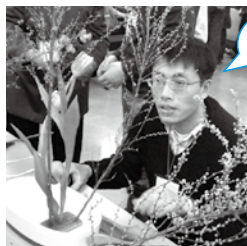
花が思ったところを向いてくれない。難しいなあ。

雪柳、チューリップ、スイートピーを使って活け花をしました。アドバイスを受けながら可愛い花相手に大奮闘しているチョウさんの様子は真剣そのものでした。おつかれさま。