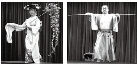
↑「藤娘」と「浦島」の実演 ←「提灯消す」のときのしぐさ。扇を開いて閉じる手さばきも見事です。

ほぼ全員が浴衣に着替え、写真の撮り合いが収まると、すばらしい日本舞踊の実演を見学。それから「お江戸日本橋」の踊りを習いました。30分くらいで動きが揃ってきたのには思わず拍手。