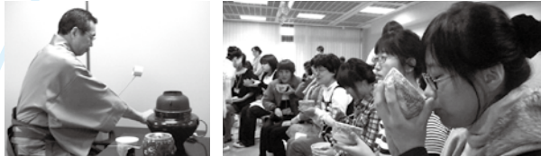
↑男性の先生が優雅にお茶をたててくださいました。 ↑順にお茶が配られます。みんな「おいしい」と嬉しそう。

「お茶は三口で飲むのよね」などとみなさんが結構詳しいのにはびっくり。お茶碗を持つしぐさはなかなかおしとやかでした。